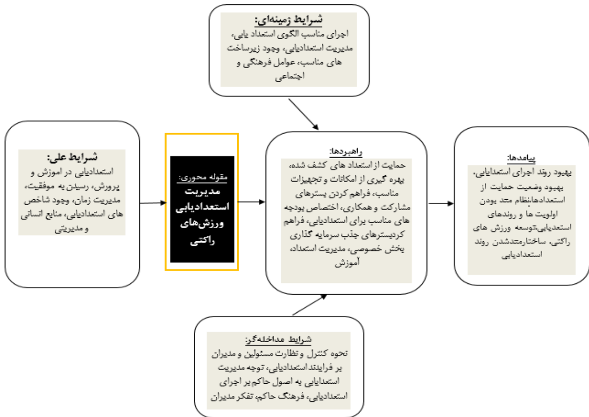
شکل ۱. مدل پارادایمی مدیریت استعدادیابی به روش استراس و کوربین در ورزش های راکتی

این مرحله از پژوهش کدگذاری گزینشی و مدل نهایی ارائه می‌گردد. در مرحله کدگذاری گزینشی یا انتخابی شکل‌گیری و پیوند هر دسته‌بندی با سایر گروه‌ها تشریح می‌شود. در این قسمت کدگذاری‌های محوری به صورت ترکیبی و محتوای هر یک از آنها در قالب کدهای نظری قرار داده شدند که در جدول زیر ارائه گردید: