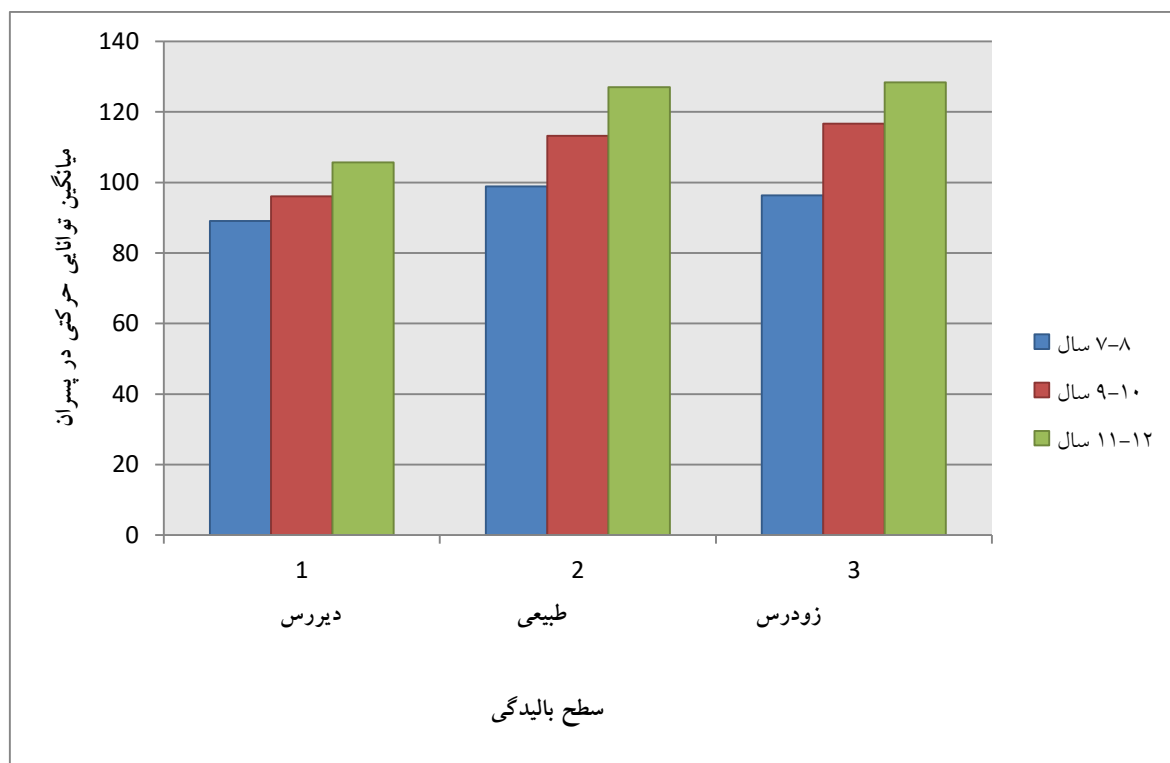
نمودار ۲. اثر تعاملی سطح بالیدگی و سن تقویمی دانش آموزان پسر

توانایی های حرکتی معنادار نیست. نمودار تعاملی ۲ نشان داد دانش آموزان پسر برای هر یک از رده های سنی ۷ تا ۸ سال، ۹ تا ۱۰ سال، ۱۱ تا ۱۲ سال در سطح بالیدگی طبیعی بالاترین نمره توانایی حرکتی و دانش آموزان پسر در رده های سنی ۷ تا ۸ سال، ۹ تا ۱۰ سال و ۱۱ تا ۱۲ سال در سطح بالیدگی دیررس دارای پایین ترین نمره توانایی حرکتی می باشند (نمودار ۲).