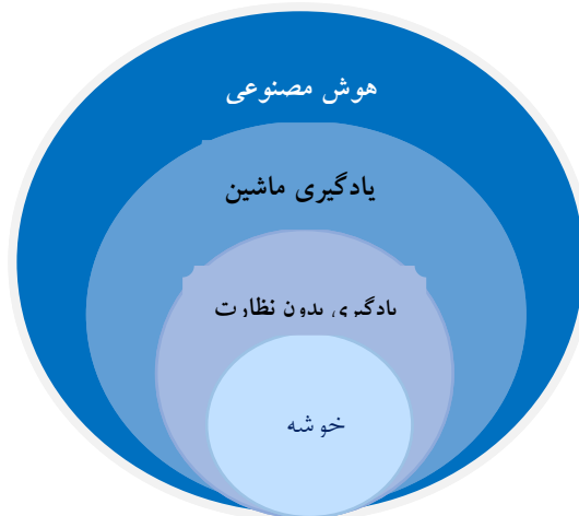
شکل ۱. جایگاه خوشه‌بندی، اقتباس از ویتن و همکاران ۲۰۱۷ (۱۲)

«خوشه‌بندی» ۱ یکی از تکنیک‌های علم یادگیری ماشین است که شامل گروه‌بندی نقاط داده می‌شود. با توجه به مجموعه‌ای از نقاط داده، می‌توان از یک الگوریتم خوشه‌بندی برای طبقه‌بندی هر نقطه داده به یک گروه خاص استفاده کرد. در تئوری، نقاط داده‌هایی که در یک گروه قرار دارند باید دارای خصوصیات و یا ویژگی‌های مشابه باشند، درحالی‌که نقاط داده در گروه‌های مختلف باید دارای خصوصیات و یا ویژگی‌های بی‌شبهت باشند. خوشه‌بندی حاصل در این پژوهش (شکل یک) محصول روش یادگیری ماشین، بدون نظارت است و یک روش معمول برای تجزیه و تحلیل داده‌های آماری است که در بسیاری از زمینه‌ها مورد استفاده قرار می‌گیرد. محققین با مشاهده و استخراج روابطی که از داده‌ها شکل گرفته می‌توانند اطلاعات ارزشمندی به دست آورند.