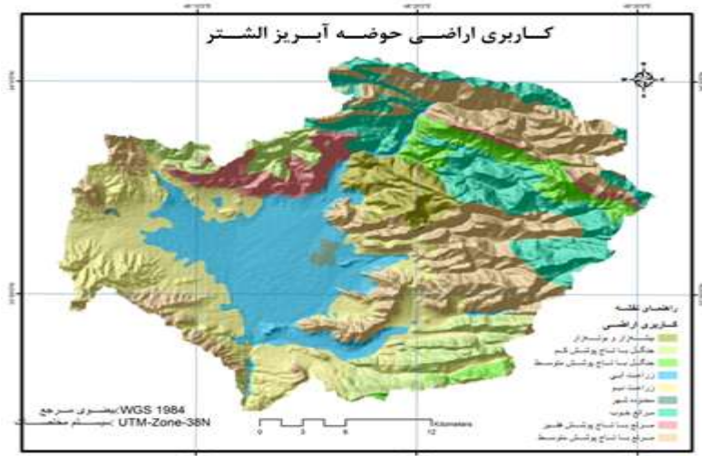
شکل ۳: وضعیت کاربری اراضی در سطح حوضه آبریز الشتر

از آنجا که در پژوهش حاضر بررسی وضعیت فرسایش حوضه و ارتباط آن با وضعیت آینده توسعه کشاورزی و، به تبع آن، توسعه سکونتگاه‌های روستایی حوضه آبریز الشتر ملاحظه شده است، پس از پهنه‌بندی فرسایش در سطح حوضه و تعیین کلاس‌های فرسایش با هم‌پوشانی لایه‌ی نقاط روستایی و شهری محدودی حوضه و انطباق کلاس‌های فرسایش با وضعیت موجود کاربری اراضی شرایط هرکدام از کاربری‌ها (جدول ۴) در سطح حوضه بررسی شد و نتایج ذیل به دست آمد: از مجموع ۲۰۸ نقطه‌ی روستایی در سطح حوضه، ۲۵ نقطه (معادل ۱۲/۰۱) درصد از نقاط روستایی در کلاس فرسایش IV و V، ۸۴ نقطه (معادل ۴۰/۳۸ درصد) در کلاس فرسایش II، ۹۸ نقطه (معادل ۴۷/۱۱ درصد) در کلاس فرسایش I و، سرانجام، ۱ نقطه (معادل ۰/۴۸ درصد) در کلاس فرسایش III قرار گرفته‌اند. به عبارت دیگر، ۸۸/۷۶ درصد نقاط روستایی در وضعیت مناسبی به لحاظ فرسایش هستند.