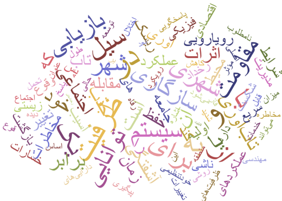
شکل ۱: ابر کلمات به‌کار رفته در تعاریف تاب‌آوری