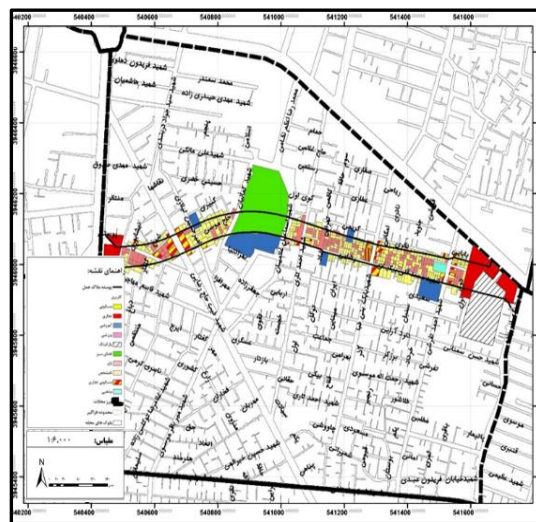
شکل ۵. کاربری‌های محدوده پوسه ۴۵ متری بزرگراه پیشنهادی