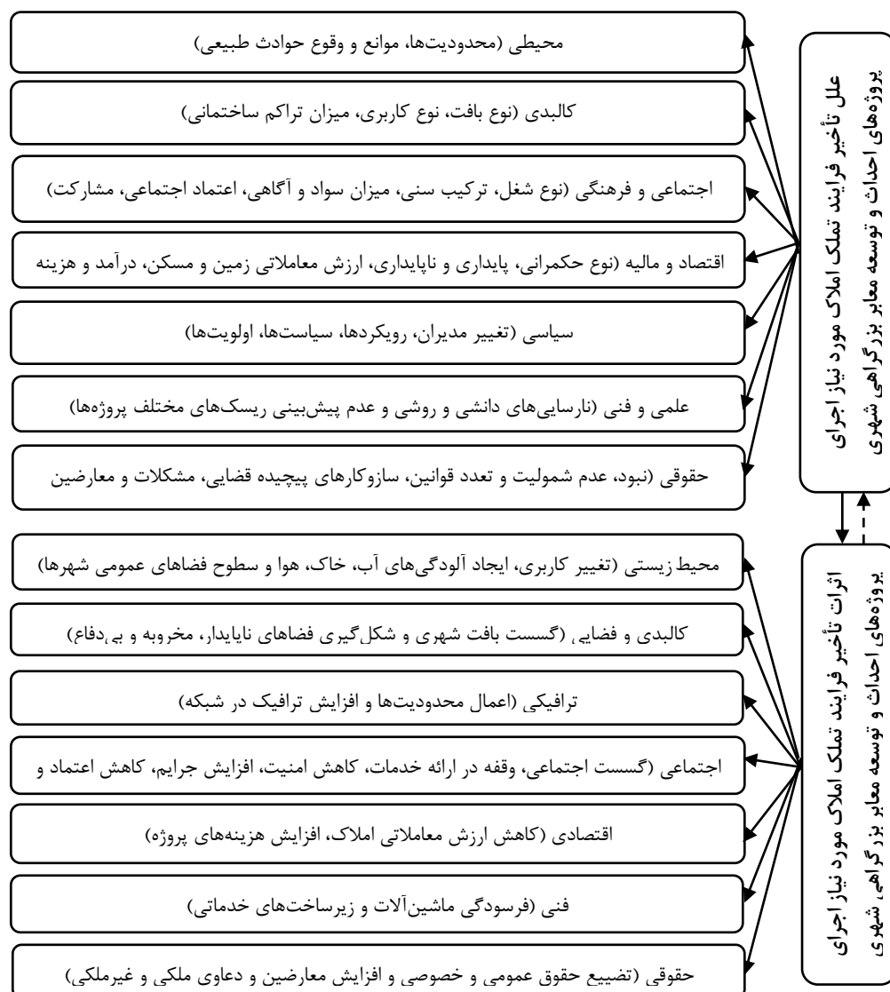
شکل ۱. مدل مفهومی (علل و تأثیر تأخیر فرایند تملک املاک و اجرای پروژه‌های احداث و توسعه بزرگراه‌های شهری)

۳. اثرات ترافیکی و حمل‌ونقلی: تأخیر مستمر و زیاد در فرایند تملک املاک مورد نیاز پروژه‌های احداث و توسعه بزرگراه‌ها و سایر جاده‌های شهری، اعمال محدودیت‌های مدیریتی و فیزیکی (بسته شدن و ایجاد مسیرهای انحرافی) و افزایش ترافیک سواره در معابر پیرامون آن پروژه‌ها را موجب می‌شود.