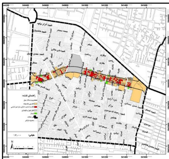
شکل ۴. نقشه وضعیت کیفیت قطعات در محور احداثی