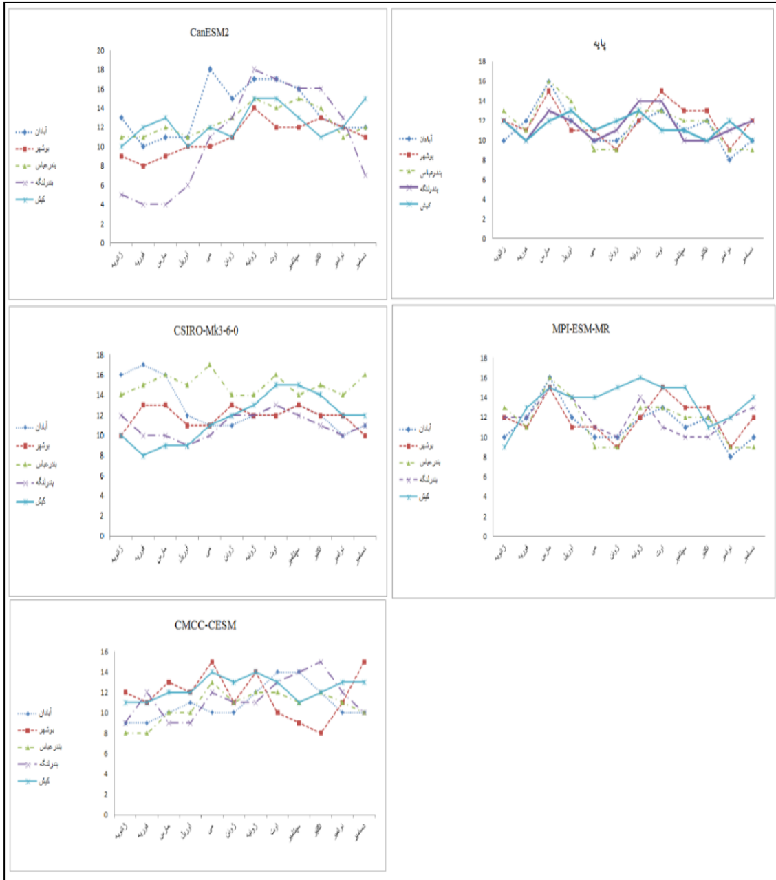
شکل ۳: امواج گرمایی استخراج شده ماهانه در داده پایه و آینده

تغییرات سالانه امواج گرمایی در دوره‌ی آینده نسبت به دوره‌ی پایه (جدول ۵) به این صورت است که فراوانی امواج گرمایی در دوره آینده برای ایستگاه‌های آبادان و بندرعباس در مدل‌های CanESM2 و CSIRO-Mk3-6-0، ایستگاه بوشهر در مدل‌های MPI-ESM-MR و CSIRO-Mk3-6-0 و ایستگاه بندرلنگه و MPI-ESM-MR و CMCC- نسبت به دوره پایه افزایش نشان می‌دهد اما ایستگاه کیش در تمام مدل‌های مورد بررسی با افزایش فراوانی امواج گرمایی در سال‌های آینده روبه‌رو است.