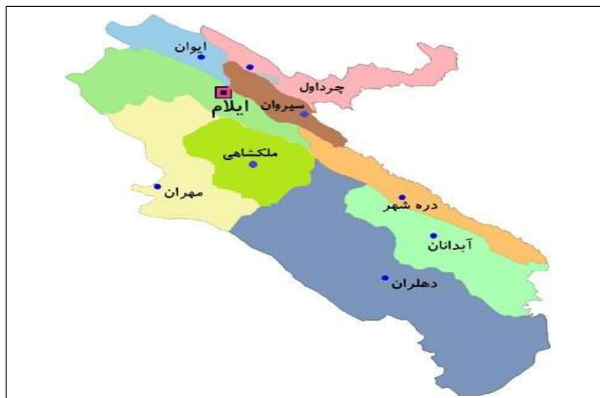
شکل ۲: موقعیت جغرافیای شهرستان دهلران در استان ایلام

شهرستان دهلران در جنوب ایلام و در فاصله ۹۱۰ کیلومتری تهران واقع شده است. دهلران آب و هوای بیابانی و نیمه بیابانی «گرم و خشک» دارد. این شهرستان در جنوب شرقی استان ایلام و جنوب غربی دینار کوه و در فاصله ۲۲۸ کیلومتری ایلام و ۱۰۰ کیلومتری شهرستان اندیمشک واقع شده است. این شهر که در دامنه جنوب و جنوب غربی دینار کوه قرار دارد. شکل ۲ موقعیت جغرافیای شهرستان دهلران در استان ایلام را نشان می دهد.