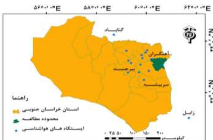
شکل ۲: موقعیت ایستگاه‌های هواشناسی محدوده مطالعه

با استفاده از داده‌های بارش روزانه ۱۵ ایستگاه هواشناسی در اطراف محدوده مطالعه (شکل ۲)، بارندگی سالانه در طول دوره سی ساله (۱۹۸۶-۲۰۱۵ میلادی) استخراج گردید سپس این داده‌ها برای محدوده مطالعه به روش IDW ۱ در نرم‌افزار ArcGIS میانمایی و با استفاده از شاخص استاندارد بارش (SPI ۲ ) سال‌های خشک، تر و نرمال مشخص شدند. برای تکمیل سال‌های فاقد داده بارندگی هریستگاه از روابط همبستگی با ایستگاه‌های مجاور و نرم‌افزار SPSS استفاده شد.