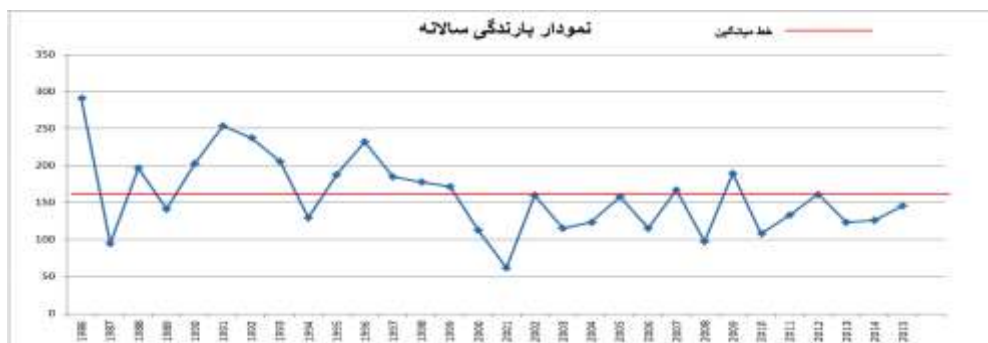
شکل ۴: تفکیک دو دوره مرطوب و خشک در بررسی سی ساله

شکل ۵، طبقات بارش سالانه در سری زمانی سی ساله محدوده مطالعه را بر اساس شاخص استاندارد بارش (SPI) نشان می‌دهد. ترسالی و خشکسالی با شدت‌های مختلف همچنین تغییرات بارندگی سالانه در سال‌های نرمال رخدادهایی هستند که در این نمودار ارائه گردیده‌اند.