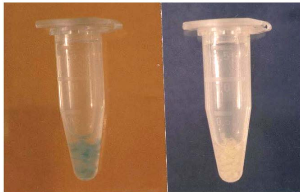
شکل ۴- بررسی آزمون GUS در گیاهان تراریخت شده در حضور سوبسترای X-Gluc ظهور رنگ آبی نشانگر بیان ژن GUS در گیاهان تراریخت (چپ) در مقایسه با گیاهان غیرتراریخت (راست) است