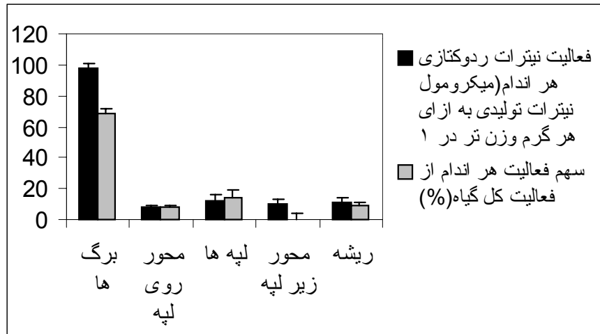
شکل ۳- فعالیت نیترات ردوکتازی اندام‌های گوناگون نمونه‌های شاهد، دانه‌ست‌های سویا رقم پرشینگ، و سهم فعالیت هر اندام از فعالیت کل گیاه بر حسب درصد. ستون‌ها و شاخص‌ها نشان‌گر میانگین و محدوده‌های خطای معیار هستند

جدول ۲- تغییرات فعالیت نیترات ردوکتازی اندام‌های گوناگون دانه‌ست‌های ۱۵ روزه سویا، رقم پرشینگ و تأثیرات شوری بر آن. آماده‌سازی نمونه‌ها، مانند شرح شکل ۲ صورت گرفته است. اعداد بر حسب میکرومول نیترات احیا شده به ازای هر گرم وزن تر اندام در یک ساعت ارائه شده‌اند و نشان‌گر میانگین و محدوده‌های خطای معیار هستند