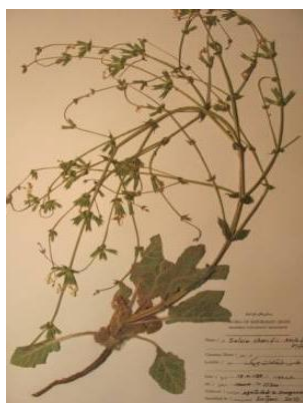
شکل ۳. تصویر گونه S. shariffi

کاسه گل و عرض کاسه گل (LEBR, WIBR, THBR, GLST, MDSL, WICA) از هم جدا می‌شوند. گونه سالویا ماکروسیفون از گونه سالویا اسپینوزا با صفاتی مانند رنگ و ضخامت براکته (سبز و علفی)، نوک دندانها و براکته به شدت خاردار، کرک براکته، بیرون زدگی خامه گل و کرک کاسه گل (WICA, TRCA, APBR, COBR, THBR, SCTE, TRBR, EXST) جدا می‌شود. در چند نمونه بررسی شده، پرشاخه بودن سالویا اسپینوزا نسبت به سالویا ماکروسیفون مشاهده شده است، اما نمی‌توان به یقین از آن به عنوان یک صفت جداکننده نام برد. گونه سالویا شریفی برای اولین بار برای خراسان گزارش می‌شود، گونه‌ای که بسیار شبیه به گونه سالویا ماکروسیفون است. در ابتدا این گونه به دلیل صفاتی مانند عرض کاسه گل، ضخامت و نوک براکته با گونه سالویا ماکروسیفون اشتباه گرفته شد. در فلورا ایرانیکا [۹]، صفت جداکننده این گونه، کوچکتر بودن براکته نسبت به کاسه گل بیان شده است. در این پژوهش مشخص شد که این صفت مناسب نیست و با کمک صفاتی چون نازک بودن شاخه‌های جانبی، شاخه‌های جانبی نازک، طول کاسه گل، براکته‌های کوچک و رأس آن‌ها (THBA, SIBR, LECA, LEBR, WIBR, APBR)، این دو گونه بهتر از یکدیگر قابل تفکیک هستند (جدول ۲) (شکل ۳).