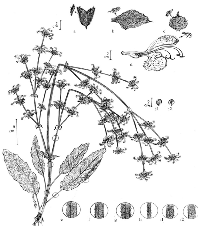
شکل ۱. شکل رویشی سالویا آتروپاتانا (۸۴): (a) کاسهگل، (b) برگ گل آذینی، (c) براکته، (d) جام گل، (e) قاعده ساقه، (f) بخش فوقانی ساقه، (g) محور گل آذین، (h) دم‌برگ، (i1) سطح فوقانی برگ، (i2) سطح تحتانی برگ، (j1، j2) فندقه (مؤلف مقاله)

تعداد گل در هر چرخه از محور گل آذین ۶-۷ گل، دمگل ۲ تا ۳/۵ میلی‌متر و تنها شامل پوشش مودار و کم و بیش زیر است.