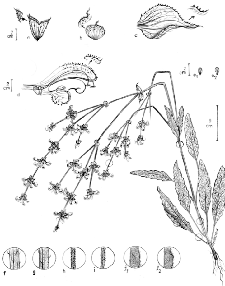
شکل ۳. شکل رویشی سالویا آتروپاتانا (۹۱): (a) کاسه گل، (b) براکته، (c) برگ گل آذینی، (d) جام گل، (e1-e2) فندقه، (f) قاعده ساقه، (g) بخش فوقانی ساقه، (h) محور گل آذین، (i) دم‌برگ، (j1) سطح فوقانی برگ، (j2) سطح تحتانی برگ. (مؤلف مقاله)

اجزاء گل: سطح کاسه‌گل دارای کرک‌های تیز زبر و خمیده و تراکم کرک متوسط تا تنک و رنگ کاسه گل سبز- بنفش است. طول سوزن لوب بالایی کاسه گل ۸/۰ - ۰/۵ میلی‌متر است. طول جام گل ۲۶-۲۵/۵ میلی‌متر، طول لوله جام گل ۵ میلی‌متر و در سطح گلبرگ کرک‌های تیز و زبر و خمیده مشاهده می‌شود. طول خامه ۴۴/۵ میلی‌متر است.