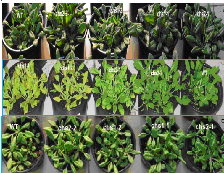
شکل ۱. گیاهان تحت تیمارهای دمایی متفاوت. الف) گیاهان شاهد، ب) گیاهان تحت تیمار سرما، ج) گیاهان تحت تنش سرما

ویژگی‌های مورفولوژیکی ناشی از دمای پایین در گیاهان جهش یافته آرابیدوپسیس تحت تیمار سرما مشاهده شد. تحت این تیمار دمایی برگ گیاهان جهش یافته زرد شد و پس از یک هفته قرارگیری در معرض تیمار سرما همه این گیاهان از بین رفتند و با بازگشت به دمای رشد نرمال زنده نماندند (شکل ۱ ب). تحت تنش سرما و شاهد گیاهان وحشی و جهش یافته ظاهر طبیعی داشتند و ویژگی مورفولوژیکی خاصی نشان ندادند (شکل ۱ الف ج).