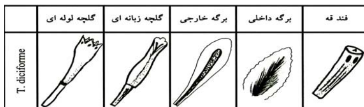
جدول ۴- تصاویر اجزای کپه در T. disciforme

از جنس Tripleurospermum تنها یک گونه T. disciforme (C.A. MEY.) SCHULTZ BIP. در خراسان موجود میباشد که شکل اجزای کپه آن در جدول ۴ ارائه گردیده است.