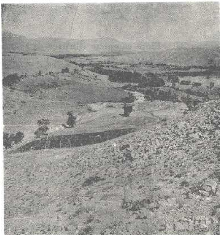
تصویر شماره ۳- دامنه شمالی کوه ازنو متشکل از خاک و واریزه آهکی ودشت و باغات شمالی تر آن که از جنس خاکهای مخلوط آهکی و آتشفشانی است .