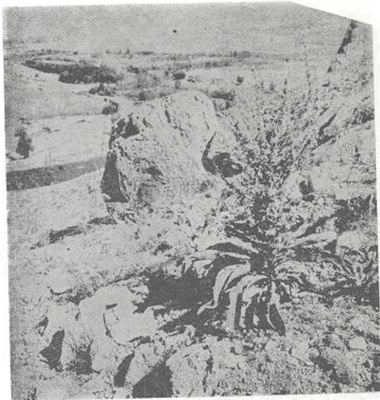
يك نمونه از گیاه Verbascum از محل مربوط به تصویر شماره ۴