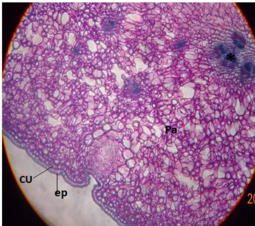
شکل ۲. اپیدرم (Ep)، کوتیکول (Cu)، پارانسیم (Pa) * دستجات اوندی

در مرحله تجزیه سلولی، ابتدا به‌علت از هم پاشیدن و از بین رفتن سلول مرکزی، حفره کوچکی تشکیل می‌شود که در نهایت به حفره‌ای بزرگ تبدیل می‌شود. سلول‌هایی که اطراف حفره قرار دارند، در مقایسه با سلول‌های کشیده بیرونی دارای دیواره نازک و سیتوپلاسم غلیظتری هستند که به‌صورت غلاف، سلول‌های ترش‌ی را در بر می‌گیرد. ضخامت دیواره‌ها احتمالاً به‌منظور استحکام بخشیدن به کیسه ترش‌ی است (شکل ۳). کیسه‌های ترش‌ی در گلبرگ دارابی در نزدیکی اپیدرم فوقانی قرار دارند. به‌تدریج به‌سمت گلبرگ در گل بالغ، حجم و تعداد لایه‌های کیسه‌های ترش‌ی افزایش می‌یابد و سلول‌های ترش‌ی کننده اسانس، سیتوپلاسم خود را از دست می‌دهند.