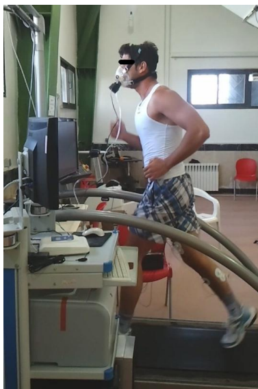
شکل ۱. پروتکل دویدن با استفاده از نوارگردان و دستگاه گاز آنالایزر متامکس در آزمایشگاه شبیه‌سازی شده به دویدن در یک مسابقه دو ۵۰۰۰ متر استقامت

هنگام اجرای آزمون، همچنان‌که سرعت دویدن افزایش می‌یافت، اکسیژن مصرفی نیز قبل از رسیدن به حالت پایدار افزایش پیدا کرد. برای بررسی تغییرات اکسیژن مصرفی در مجموع پروتکل به این صورت عمل شد که اکسیژن مصرفی دو دقیقه انتهایی تمام آزمودنی‌ها برای هر سه سرعت ۴، ۶ و ۸ کیلومتر بر ساعت انتخاب شد. در نتیجه برای هر وزن یک ستون از داده‌های اکسیژن مصرفی به دست آمد. با مقایسه اکسیژن مصرفی کل دوره آزمون در هر وزن، به مشاهده اثر تغییرات وزن کفش بر میزان تغییرات اکسیژن مصرفی و در نتیجه اقتصاد دویدن پرداخته شد. اقتصاد دویدن از طریق محاسبه میانگین اکسیژن مصرفی دو دقیقه انتهایی هر مرحله، در صورتی‌که به حالت پایدار می‌رسید، تخمین زده شد. میانگین اکسیژن مصرفی به دست آمده، هزینه اکسیژن را که برای رسیدن به آن سرعت نیاز است نشان می‌دهد که می‌تواند بین دوندها مقایسه شود. مصرف اکسیژن کمتر برای رسیدن به یک سرعت مشخص نشان‌دهنده دویدن اقتصادی‌تر است. برای محاسبه OUES از روش بابا و همکاران (۱۹۹۶) استفاده شد (۱۶) که در آن اکسیژن مصرفی (میلی لیتر بر دقیقه) روی محور عمودی و تهویه کل (میلی لیتر بر دقیقه بر کیلوگرم) در تابع لگاریتم روی محور افقی قرار می‌گیرد. شیب خط معادله یک مجهولی ارتباط دو محور افقی و عمودی به عنوان OUES در نظر گرفته می‌شود (معادله ۱) (۱۴، ۱۵).