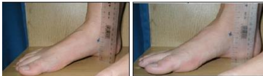
وضعیت بدون تحمل وزن

در ادامه مطالعه منصرف شدند. تمام فعالیت‌های تمرینی بازیکنان از ابتدا تا انتهای فصل در فرم ویژه به صورت روزانه به دست مربی تیم ثبت می‌شد. از کادر پزشکی تیم‌های مشارکت‌کننده درخواست شد آسیب‌های بازیکنان را در فرم ویژه ثبت کنند. این فرم‌ها به صورت هفتگی جمع‌آوری می‌شد. در این مطالعه، آسیبی ثبت می‌شد که در تمرین یا مسابقه رخ داده باشد و بازیکن آسیب‌دیده قادر نباشد در جلسه تمرینی یا مسابقه روز بعد تیم (حداقل ۴۸ ساعت) مشارکت جوید (تعریف آسیب بر مبنای غیبت از تمرین یا مسابقه) (۲،۶). در ابتدای این مطالعه، فرم رضایت‌نامه اخلاقی به دست بازیکنان امضا شد و سپس، در ابتدای فصل، افت ناوی پای چپ و راست، زاویه Q چپ و راست، زانوی پرائتزی، زانوی ضربدری و زاویه هایپیر اکستنشن مفصل زانوی بازیکنان اندازه‌گیری شد. برای اندازه‌گیری افت ناوی از آزمون برودی استفاده شد. برای این کار، ابتدا از آزمودنی درخواست می‌شد روی صندلی بنشیند، درحالی‌که ران و زانوی او در وضعیت فلکشن ۹۰ درجه، کف پاهای او روی زمین و مفصل ساب تالار او در وضعیت خنثی و در وضعیت بدون تحمل وزن قرار داشت. آزمونگر برجستگی استخوان ناوی آزمودنی را لمس و مشخص می‌کرد و فاصله آن را تا زمین با خطکش اندازه‌گیری می‌کرد. سپس، از آزمودنی خواسته شد در وضعیت ایستاده قرار گیرد و پاها را به اندازه عرض شانه باز کند و وزن بدن را به طور مساوی روی دو پا در وضعیت تحمل وزن قرار دهد. فاصله استخوان ناوی تا زمین دوباره اندازه‌گیری خواهد شد. اختلاف بین این دو وضعیت به میلی‌متر به منزله مقدار افت ناوی ثبت می‌شد (شکل ۱) (۲۳).