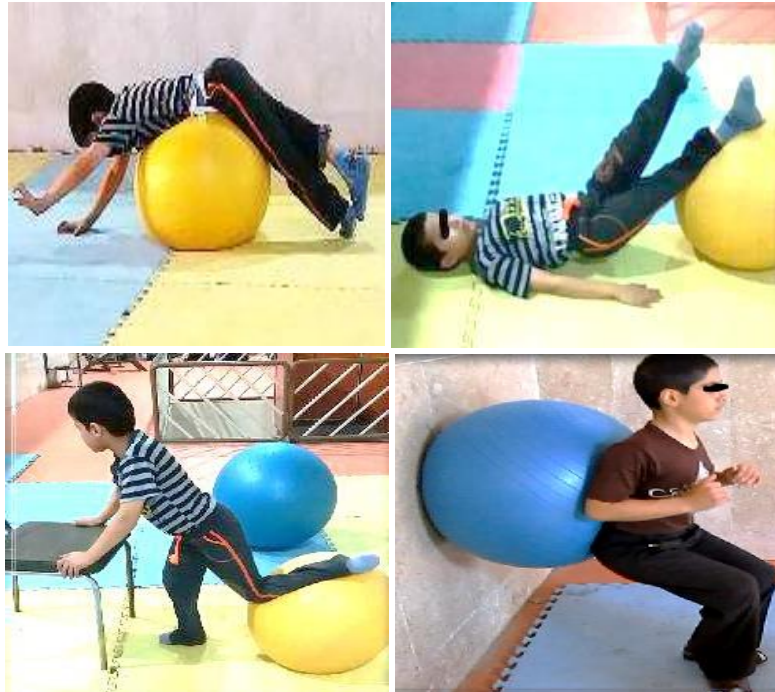
شکل ۳. نمونه‌هایی از تمرینات انجام شده

در تحقیق حاضر برای طبقه‌بندی و خلاصه‌سازی اطلاعات از آمار توصیفی، میانگین و انحراف معیار و برای تحلیل داده‌ها از آزمون t وابسته در سطح معناداری ( P \leq 0/05 ) در نرم افزار آماری SPSS نسخه ۲۲ استفاده شد.