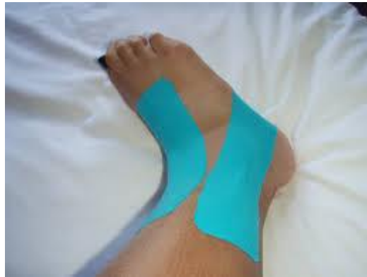
شکل ۱. تیپ کینزیو در مچ پا