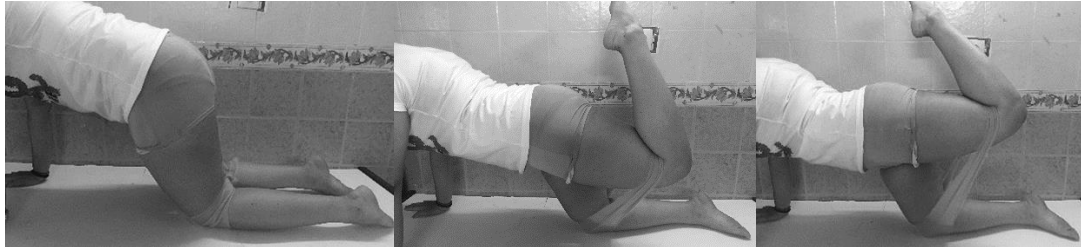
شکل ۳ نحوه انجام تمرین آزمودنی‌های گروه تجربی (از چپ به راست: ابتدا، میانه و انتهای حرکت باز کردن ران با مقاومت کش تمرین)

بیش از حد ران در برابر مقاومت کش تمرین) و برای ویژه تر کردن تمرین به صورت برونگرا، ۳ ثانیه انقباض برونگرا (حرکت خم کردن ران (بازگشت به وضعیت شروع حرکت)) طبق تصویر شماره ۳ انتخاب شد. اگرچه آزمون بر روی پای برتر افراد صورت می گرفت، به دلایل اخلاقی و به جهت برهم نزدن تعادل عضلانی بدن در دو سمت، تمرینات تقویتی به صورت متقارن برای هر دو پا انجام گرفت.