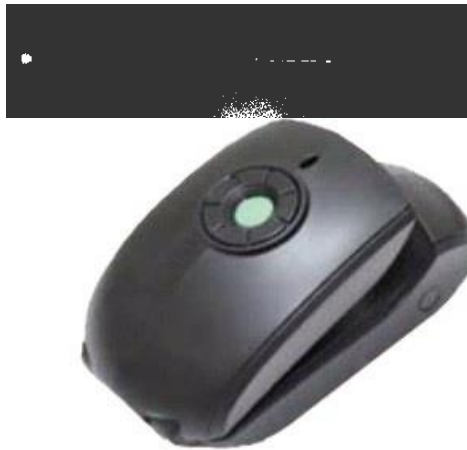
شکل ۱. سیستم آنالیزور لندمارک‌های بدنی

سیستم آنالیزور لندمارک‌های بدنی از یک قلم (فرستنده) و دوربین (گیرنده) که هر دو مجهز به سنسور IR هستند (کد ثبت اختراع: ۹۳۲۰۸) تشکیل شده است (شکل ۱).