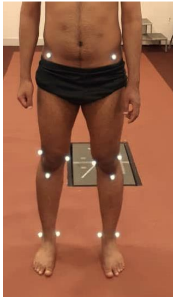
شکل ۲. لندمارک‌های آناتومیکی

BLA متعلق به شرکت پویان آزما (شکل ۳). برای هر آزمودنی، سه اندازه‌گیری توسط تکنسین‌های با تجربه انجام شد و میانگین این سه آزمون برای تجزیه و تحلیل مورد استفاده قرار گرفت.