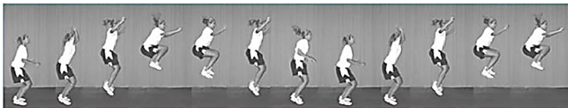
شکل ۱. تست پرش تاک (۳۳)

در این پژوهش قد آزمودنی‌ها با قدسنج و وزن آن‌ها از ترازوی دیجیتال استفاده شد. جهت ارزیابی نقص تنه از تست پرش تاک با پایایی بین آزمونگر (۹۳/۱) و پایایی درون آزمونگر (۸۷/۱) استفاده شد. در این آزمون فرد با پاهای باز به اندازه عرض شانه می‌ایستد و به صورت عمودی شروع به پرش می‌کند و زانوهای خود را تا حد امکان بالا می‌آورد. در بالاترین نقطه پرش، ران‌ها موازی با زمین قرار می‌گیرند. بلافاصله بعد از فرود، فرد باید پرش تاک بعدی را شروع کند. آزمودنی پرش تاک را به مدت ۱۰ ثانیه به صورت متوالی تکرار می‌کند. برای بهبود دقت ارزیابی از دو دوربین فیلمبرداری در دو نمای قدامی و جانبی استفاده شد، دوربین‌ها با فاصله سه متری از آزمودنی‌ها تنظیم شدند تا تصویر به صورت درشت‌نمایی شده برای بررسی در اختیار پژوهشگر قرار بگیرد، پس از انجام آزمون، برای بررسی سکانس‌های پرش، از نرم‌افزار کینوا استفاده شد فردی که قادر نباشد در محل شروع پرش خود فرود بیاید، در نقطه اوج پرش ران‌های موازی با زمین قرار نگیرد و پرش هایش در طول ۱۰ ثانیه با وقفه انجام گیرد، به عنوان فرد دارای نقص تنه در نظر گرفته شد (۱۸). هر آزمودنی سه بار با آزمون پرش ارزیابی شد و میانگین امتیازات ورزشکاران ثبت شد تا افراد مبتلا به نقص عصبی - عضلانی و به خصوص نقص تنه شناسایی شوند (شکل ۱) (۱۸).