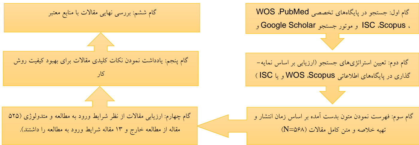
دیاگرام 1. نحوه بررسی کیفیت مقالات

تحلیل حذف شد. برای مشخص کردن عدم تجانس از آزمون I^2 استفاده شد که مقدار ناهمگونی بر اساس دستورالعمل کوکران به شرح زیر > 25\% = کم ، > 50\% = متوسط و > 75\% = ناهمگنی زیاد تفسیر شد. در صورت وجود ناهمگنی، در ادامه تحلیل حساسیت از طریق روش خارج کردن یک به یک مطالعات با لحاظ کردن I^2 کمتر از 50 به عنوان ملاک انجام شد (13). سوگیری انتشار نیز با استفاده از تفسیر بصری از فونل پلات بررسی شد که در صورت وجود سوگیری، تست ایگر به عنوان به مشخص کننده ثانویه استفاده شد که در آن P < 0/1 به عنوان وجود سوگیری انتشار قلمداد شد. همچنین همبستگی سن و شاخص توده بدن آزمودنی‌ها با اندازه اثر تفاوت‌های میانگین استاندارد شده با استفاده از رگرسیون مدل لحظه‌ای بررسی شد (13). تمام آزمون‌های آماری با استفاده از نرم افزار CMA انجام شدند.