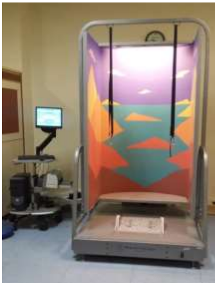
شکل ۱. دستگاه پاسچروگرافی پویای کامپیوتری.

برای اجرای آزمون SOT با انتخاب نوع آزمون تعبیه شده در دستگاه، شرکت‌کننده با پاهای برهنه بر روی سکوى نیروی دستگاه پاسچروگرافی می‌ایستاد به گونه‌ای که فاصله پاها به اندازه عرض لگن معادل ۵۰ درصد فاصله هیپ تا هیپ ۱ (خارهای خاصه قدامی - فوقانی ۲ )، دست‌ها در کنار بدن و نگاه به روبرو باشد. شرکت‌کنندگان در شش وضعیت مذکور مورد آزمون قرار گرفتند. طبق پروتکل تعریف شده، هر یک از این آزمون‌ها ۳ بار انجام شد و میانگین حاصل از سه بار به‌عنوان شاخص کنترل قامت (از صفر تا ۱۰۰) مورد استفاده قرار گرفت.