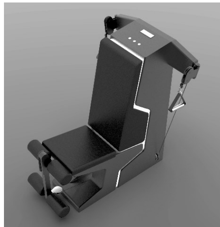
شکل ۱. مدل سه بعدی دستگاه توسط نرم‌افزار راینو

در ابتدا ایده اصلی این دستگاه که همان مکانیزم مکانیکی تغییر گشتاور خروجی بود، پس از انجام محاسبات اولیه بر روی کاغذ، در نرم‌افزار راینو به صورت شماتیک ترسیم شد. سپس با توجه به دامنه تغییرات گشتاور و محاسبه ابعاد و اندازه دقیق اجزای مکانیزم، این قطعات توسط نرم‌افزار اتوکد ترسیم شده و با استفاده از این نقشه‌های دوبعدی و انتقال به نرم‌افزار راینو حجم سه‌بعدی نهایی با دقت مدل‌سازی شد. پس از طراحی مکانیزم، ابعاد اسکلت، بدنه و فرم دستگاه و نشیمنگاه آن با توجه به ابعاد و ارگونومی بدن انسان [۱۴] در نرم‌افزار راینو طراحی و مدل‌سازی شد (شکل ۱).