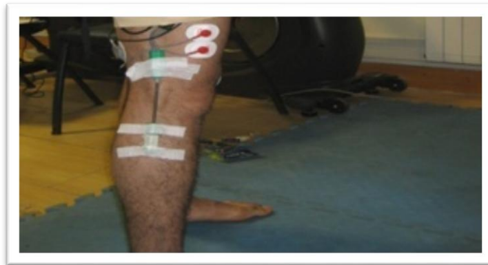
شکل ۲. قرارگیری الکتروگونیا متر

الکتروگونیا متر نیز در بخش خارجی مفصل زانو و روی اپیکندیل خارجی مفصل مطابق شکل ۲ قرار داده شد.