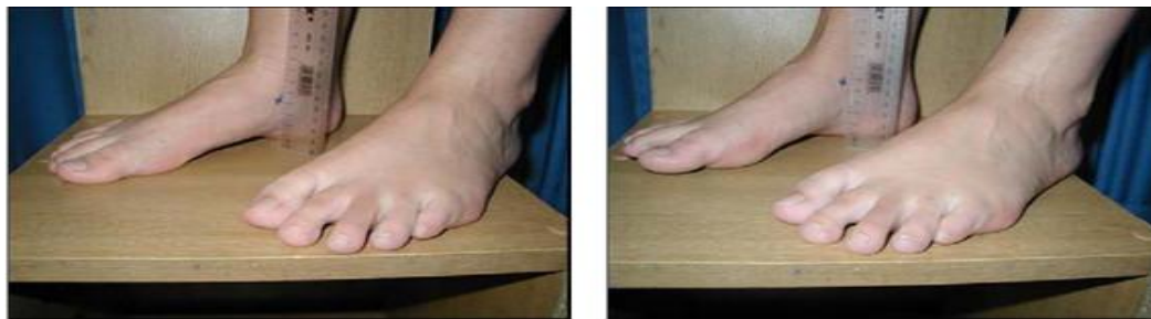
شکل ۱. روش اندازه‌گیری افت استخوان ناوی

ایستاده تعادل خود را حفظ کند، به او اجازه داده شد تا نوک انگشت پای دیگر را روی زمین قرار دهد. در این حالت نیز فاصله برجستگی استخوان ناوی تا سطح جعبه اندازه‌گیری و ثبت شد. آزمونگر فاصله برجستگی استخوان تا سطح جعبه را در حالت تحمل وزن (ایستاده) از فاصله استخوان ناوی تا سطح جعبه در حالت بدون تحمل وزن (نشسته روی صندلی) کسر می‌کرد که عدد به دست آمده به منزله اندازه افتادگی استخوان ناوی ثبت می‌شد. اندازه‌گیری افتادگی ناوی در هر آزمودنی سه بار انجام شد و میانگین آنها به منظور طبقه‌بندی افراد در سه گروه پای طبیعی، پای صاف و پای گود به کار رفت. آزمودنی‌های با افتادگی ناوی بیشتر از ۱۰ میلی‌متر، در گروه کف پای صاف بین ۴ تا ۹ میلی‌متر، در گروه کف پای طبیعی و کمتر از ۴ میلی‌متر، در گروه کف پای گود قرار گرفتند (۱۶۷) (شکل ۱). با عنایت به استاندارد بودن، این آزمون اعتبار لازم را برای سنجش مقدار پرونی‌شین پا دارد. ضریب پایایی آن را مولر و همکاران (۱۹۹۳) r = 0.85 ، شالتز و همکاران (۲۰۰۶) r = 0.80 درصد = ۲، ایوانز و همکاران (۲۰۰۳) r = 0.76 و جی هرتل و همکاران (۲۰۰۴) r = 0.70 گزارش کرده‌اند (۳۱).