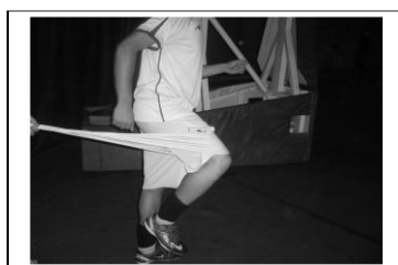
دست و پای مخالف (راه رفتن)