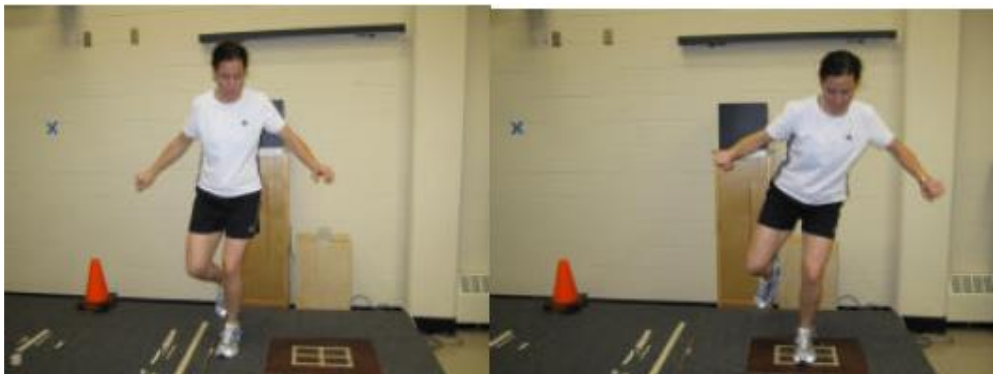
شکل ۲. نحوه انجام پروتکل جهش جانبی روی دستگاه توزیع فشار کف پای