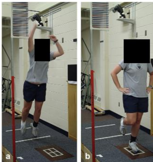
شکل ۱. نحوه انجام پروتکل پرش-فرود روی دستگاه توزیع فشار کف پا

می‌کرد. آزمودنی‌ها چندین مرتبه آزمون را به منظور آشنایی انجام می‌دادند و در آخر، سه مرتبه، آزمون تکرار و داده‌ها ثبت می‌شد (۱۶) (شکل ۱).