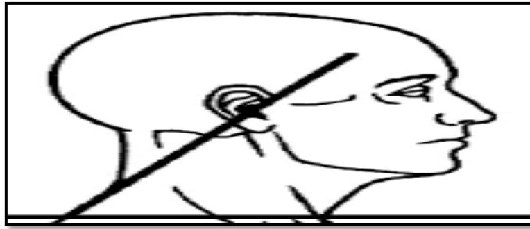
شکل ۲. نحوه محاسبه زاویه کرانیوورترال