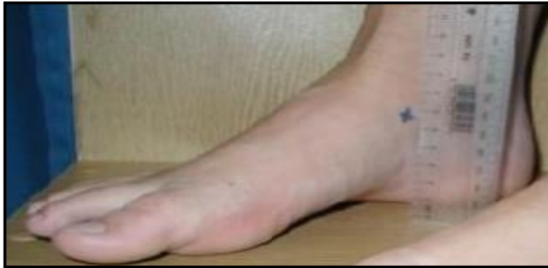
شکل ۳. اندازه گیری افت ناوی

در جدول شماره ۱، میانگین و انحراف معیار اطلاعات توصیفی مربوط به اندازه گیری های آنترپومتریک آزمودنی ها شامل قد، وزن و سن جهت شناخت بیشتر ویژگی های آزمودنی ها ارائه شده است.