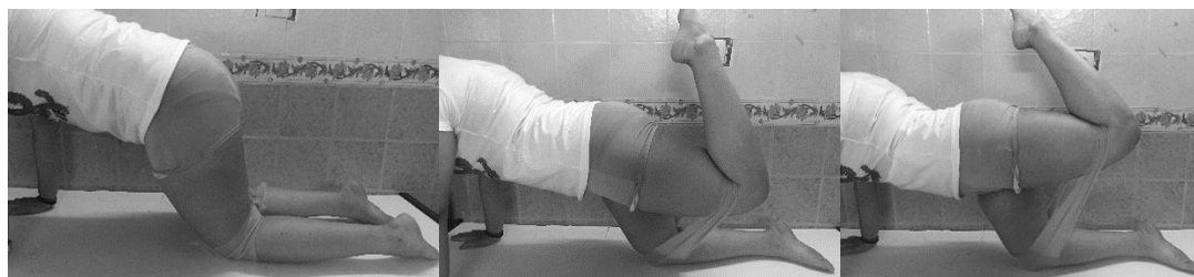
شکل ۳ نحوه انجام تمرین آزمودنی‌های گروه تجربی (از چپ به راست: ابتدا، میانه و انتهای حرکت باز کردن ران با مقاومت کش تمرین)

بیش از حد ران در برابر مقاومت کش تمرین) و برای ویژه تر کردن تمرین به صورت برونگرا، ۳ ثانیه انقباض برونگرا (حرکت خم کردن ران (بازگشت به وضعیت شروع حرکت)) طبق تصویر شماره ۳ انتخاب شد. اگرچه آزمون بر روی پای برتر افراد صورت می گرفت، به دلایل اخلاقی و به جهت برهم نزدن تعادل عضلانی بدن در دو سمت، تمرینات تقویتی به صورت متقارن برای هر دو پا انجام گرفت.