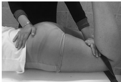
شکل ۱. نحوه اندازه‌گیری بیشینه قدرت ایزومتریک عضله سرینی بزرگ

انجام آزمون از بندهای محکم غیرقابل ارتجاع که از یک سمت به انتهای اندام موردنظر و از طرف دیگر به پایه تخت بسته می‌شد استفاده شد. این امر باعث اعتباربخشی بیشتر به آزمون‌های سنجش قدرت ایزومتریک با دینامومتر دستی می‌گردد (۲۶). از آزمودنی خواسته می‌شد که ۵ شماره با نهایت قدرت به دینامومتر دستی دیجیتال مدل JTECH Medical MN084_A Commander که در انتهای اندام و زیر بند ثابت‌کننده قرار داشت فشار وارد کند. مجموعاً سه بار اندازه‌گیری قدرت با انجام باز کردن بیش از حد ران به مقدار ۲۰ درجه، انقباضات ۵ ثانیه‌ای و استراحت ۳۰ ثانیه‌ای بین تکرارها انجام شد. میانگین سه عدد به دست آمده به عنوان ماکزیمم قدرت ایزومتریک عضله برحسب نیوتن ثبت گردید (۲۷). عدد به دست آمده بر وزن فرد برحسب نیوتن تقسیم شده و ضربدر عدد ۱۰۰ شد و ماکزیمم قدرت عضله برحسب درصد وزن بدن گزارش گردید.