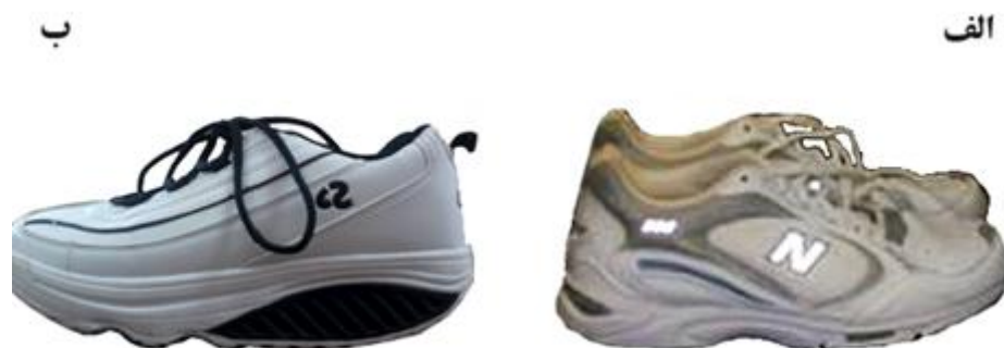
شکل ۱- الف: کفش کنترل؛ ب: کفش ناپایدار

کفش‌های تحت بررسی در این پژوهش در اندازه‌های ۴۲ تا ۴۴ برحسب اندازه پای آزمودنی‌ها تهیه شدند که شامل کفش کنترل (New Balance) و کفش ناپایدار (Perfect Steps- TM-030709 VP) بود (شکل ۱). این کفش‌ها به منظور مقایسه تأثیر شکل هندسه زیره کفش بر متغیرهای مرتبط با نیروی عکس‌العمل زمین انتخاب شدند. کفش ناپایدار انحنایی در راستای قدامی - خلفی دارد؛ درحالی که کفش کنترل دارای زیره معمولی بود.