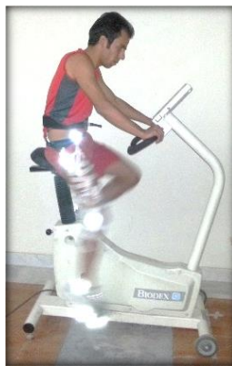
تصویر ۱: نحوه اجرای پروتکل رکاب زدن توسط آزمودنی

پس از نصب مارکرها روی بدن، آزمودنی برای اجرای پروتکل رکاب زدن آماده شد. نحوه اجرای رکاب زدن روی دوچرخه ایزوکیتیک برای آزمودنی توضیح و آموزش داده شد. هر آزمودنی ابتدا روی زین دوچرخه قرار می‌گرفت و ارتفاع زین برای وی تنظیم می‌شد. ارتفاع زین برای تمام آزمودنی‌ها به نحوی تنظیم می‌شد که در زمان قرار گرفتن رکاب در پایین‌ترین موقعیت، اندام تحتانی آزمودنی به طور کامل در حالت اکستنشن قرار گیرد. از آزمودنی‌ها خواسته شد هنگام انجام پروتکل رکاب زدن در شدت کار ۷۰ دور بر دقیقه رکاب زده و زمانی که به شدت کار ثابت ۷۰ دور بر دقیقه می‌رسید، اطلاعات کینماتیکی از اندام تحتانی به مدت ۳۰ ثانیه ثبت می‌شد. آزمودنی‌ها در طی مدت زمان ۳۰ ثانیه حدود ۳۳ چرخه کامل رکاب زدن را اجرا می‌کردند که از بین آنها تعداد ۳۰ چرخه متوالی برای انجام تحلیل‌های تغییرپذیری استخراج شد و مورد استفاده قرار گرفت. تصویر ۱ نحوه قرار گرفتن آزمودنی روی دوچرخه ایزوکیتیک را نشان می‌دهد.