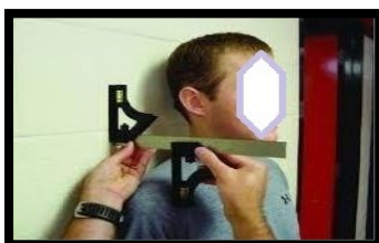
شکل ۷. اندازه‌گیری شانه روبه‌جلو (برگرفته از کار پژوهشی معصومی و همکاران ۲۰۱۱)

اندازه‌گیری شانه به جلو: برای تعیین کمیت وضعیت شانه به جلو (شانه گرد) از دستگاه چهار گوش دوگانه (طبق مدل 420 EM) استفاده شد. روایی و اعتبار چهار گوش ارزیابی شانه به جلو به صورت تخمین، بیان شده و محققین گزارش کردند که روش استفاده از چار گوش دوگانه همبستگی متوسطی با اندازه‌گیری رادیوگرافی داشته و از اعتبار بالایی ( ICC=0/89 ) برخوردار است (۱۱). در این روش از آزمودنی خواسته شد پوشش بالاتنه خود را درآورده و روبروی آزمونگر بایستد. بعدازآن زائده آخرومی سمت چپ و راست به عنوان نقطه‌ی مرجع علامت‌گذاری شد. سپس آزمودنی در جلوی دیوار ایستاده و ده بار درجای نظامی انجام داده، شانه‌هایش را سه بار به طرف جلو و عقب گرد کرده و سپس پنج بار سرش را جلو و عقب می‌برد. این توالی حرکت برای ایجاد یک وضعیت ایستادن نرمال انجام شد. آزمودنی بعدازآن به طرف عقب به سمت دیوار حرکت کرد تا وقتی که باسنش دیوار را لمس کند در این وضعیت باقی می‌ماند تا اندازه‌گیری کامل شود. بعدازآن فاصله بین دیوار و سر قدامی زائده آخرومی با استفاده از چهار گوش دوگانه به سانتی‌متر ثبت می‌شد، در ضمن اندازه‌گیری در هر شانه سه بار تکرار شده و میانگین آن‌ها در دست برتر (دست برتر آزمودنی‌ها قبل از آزمون با پرتاب توپ معلوم شده بود) استفاده می‌شد (۱۱، ۱۶).