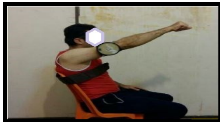
شکل ۲. وضعیت قرارگیری فلکسومتر جهت ارزیابی حس عمقی دور شدن و خم شدن (برگرفته از کار پژوهشی صاحب‌الزمانی و همکاران ۱۳۹۷)