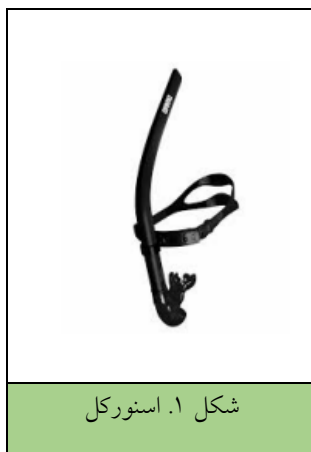
شکل ۱. اسنورکل