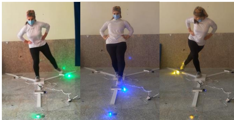
شکل ۲. نحوه اندازه‌گیری تست تعادل واکنشی

در این تست خطاهای تعادل شامل: جدا شدن دست از لگن، قدم برداشتن، سقوط، خم شدن، کج شدن هنگام عمل رساندن پا، بلند شدن پاشنه از سطح ۷، قرار دادن پای آزاد روی زمین بیش از ۲ ثانیه از موقعیت استاندارد می‌باشد.