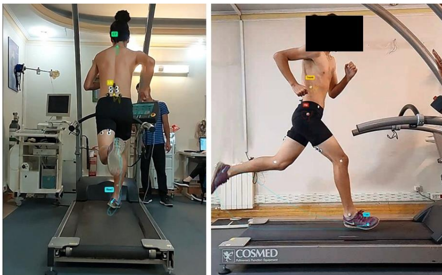
شکل ۲. آزمون دویدن

جهت بررسی کینماتیک دویدن در سرعت بالا از ارزیابی کینماتیکی دو بعدی توسط دوربین سرعت بالا ساخت شرکت سونی IMX514 (برای متغیرهای خم شدن توراسیک و خم شدن جانبی توراسیک) و همچنین ارزیابی سه بعدی کینماتیک با استفاده از شتاب سنج (ارزیابی دامنه تیلت قدامی لگن)، استفاده شد. مارکرها بر روی دنده دوازدهم، خار خاصره قدامی فوقانی، برجستگی بزرگ ران، کندیل خارجی زانو، قوزک خارجی مچ پا، استخوان پنجم کف پا، پاشنه، مهره هفتم گردنی و مهره پنجم کمری قرار گرفتند. پس از مارک‌گذاری آزمودنی‌ها و قرارگیری مناسب محل دوربین‌ها، با توجه به قد آزمودنی‌ها، آزمون دویدن بر روی تردمیل انجام گرفت. با توجه به این‌که آسیب همسترینگ در سرعت‌های بالای دویدن رخ می‌دهد، سرعت مورداستفاده در این آزمون ۲۰ کیلومتر بر ساعت و بدون شیب بود (شکل ۲) (۲۴). ابتدا جهت گرم کردن، ورزشکار ۱۰ دقیقه بر روی سرعت‌های کمتر شروع به راه رفتن و نرم دویدن می‌کرد. وقتی که به سرعت ۲۰ کیلومتر بر ساعت رسید به تعداد ۳۰ قدم در این سرعت می‌دوید. داده‌های مورد ارزیابی در قدم‌های بین ۱۵ تا ۲۵ ضبط شدند. همچنین این اندازه‌گیری‌ها ۳ بار انجام گرفت و میانگین داده‌ها ثبت شد. جهت جلوگیری از خستگی، آزمودنی بین هر بار دویدن ۵ دقیقه استراحت می‌کرد.