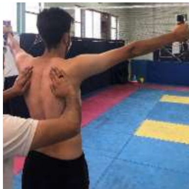
تصویر ۱. آزمون دیسکنزی کتف برای تعیین نوع دیسکنزی کتف