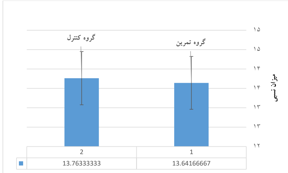
نمودار ۱. میانگین و انحراف استاندارد \Delta ct GPX4 در هر دو گروه