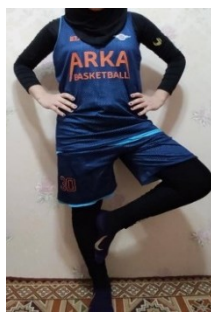
شکل ۳. ارزیابی تعادل ایستا

جهت ارزیابی تعادل ایستا از تست فلامینگو (ایستادن روی پای برتر با چشمان بسته) با پایایی درون آزمونگر خوب (۰/۹۹ تا ۰/۸۷) و پایایی باز آزمایشی ضعیف تا خوب (۱ تا ۰/۵۹) استفاده شد. در این آزمون شرکت کننده بر روی پای ترجیحی خود ایستاده و دست ها را در ناحیه کمر قرار داد. سپس پای دیگر به اندازه تقریباً ۱۰ سانتیمتر از سطح موردنظر (زمین) جدا شده و با ارائه محرک فرد، چشمان خود را باید ببندد. نمره تعادل ایستای این فرد با مقدار زمانی که پای خود را بالا نگه داشته و یا تعادل فرد دچار اختلال نشده به دست آمد (شکل ۳) (۲۵).