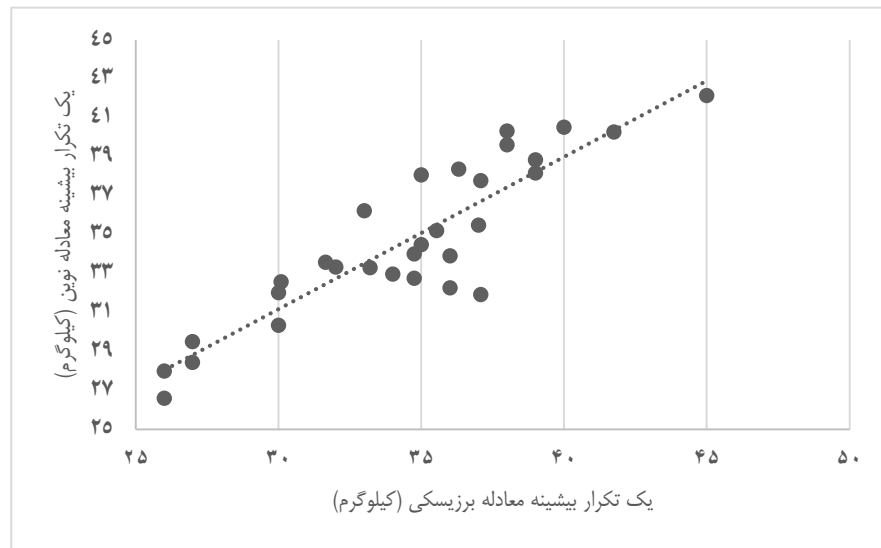
شکل ۱. همبستگی یک تکرار بیشینه با روش معادله برزیسکی و RPE