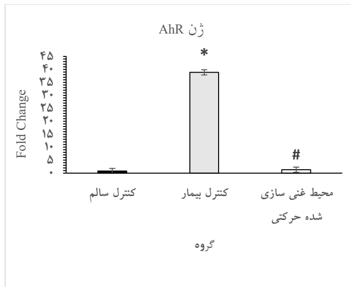
شکل ۲. بیان ژن گیرنده آریل هیدروکربن (AhR) در بین گروه‌های مطالعه. * P < 0.05 در مقایسه با گروه کنترل سالم. # P < 0.05 در مقایسه با گروه کنترل بیمار.