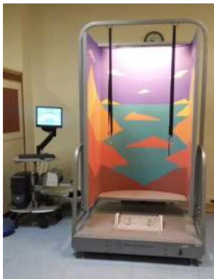
شکل ۱. دستگاه پاسچروگرافی پویای کامپیوتری.

برای اجرای آزمون SOT با انتخاب نوع آزمون تعبیه شده در دستگاه، شرکت‌کننده با پاهای برهنه بر روی سکوى نیروی دستگاه پاسچروگرافی می‌ایستاد به گونه‌ای که فاصله پاها به اندازه عرض لگن معادل ۵۰ درصد فاصله هیپ تا هیپ ۱ (خارهای خاصه قدامی - فوقانی ۲ )، دست‌ها در کنار بدن و نگاه به روبرو باشد. شرکت‌کنندگان در شش وضعیت مذکور مورد آزمون قرار گرفتند. طبق پروتکل تعریف شده، هر یک از این آزمون‌ها ۳ بار انجام شد و میانگین حاصل از سه بار به‌عنوان شاخص کنترل قامت (از صفر تا ۱۰۰) مورد استفاده قرار گرفت.