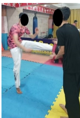
شکل ۱. پروتکل خستگی عملکردی

جهت اعمال پروتکل خستگی، از پروتکل خستگی عملکردی رشته تکواندو که اثرگذاری آن پیش از این توسط میرجانی و همکاران به اثبات رسیده است استفاده شد (۳). پروتکل مذکور به این صورت بود که آزمودنی‌ها ضربه آبدولیوچاگی را با حداکثر توان و در حداقل زمان اجرا، در مسیر هشت متری (برابر با طول زمین تکواندو) بصورت متوالی (یک ضربه با پای چپ و یک ضربه با پای راست) و رفت و برگشت، اجرا کنند. هر رفت و برگشت در این مسیر یک ست در نظر گرفته شد و پیش از اجرای پروتکل خستگی به منظور آشنایی افراد با نحوه‌ی اجرا، هر آزمودنی دو مرتبه ست مذکور را اجرا کرد. پس از شروع در جریان پروتکل خستگی بین هر ست دو برابر زمان به دست آمده در ست اول (نسبت کار به استراحت یک به دو) به افراد استراحت فعال بصورت رقص پای تکواندو داده شد، تا جایی که فرد به خستگی برسد. خستگی زمانی در نظر گرفته شد که افراد ۳۰ مرتبه این ست را در مدت زمان حداقل ۱۹ دقیقه طی کرده و بر اساس مقیاس بورگ، خستگی برابر با ۱۷ به بالا را گزارش کنند (۳).