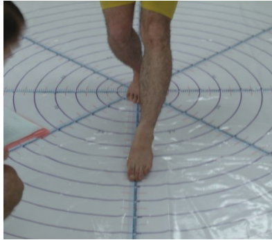
شکل ۳. آزمون تعادل پویا (۲)

تبادل ایستا، هر آزمودنی این تست را سه مرتبه اجرا و میانگین سه اجرای وی به عنوان رکورد نهایی وی در نظر گرفته شد. شافر ۱ پایایی بسیار بالایی (۰/۹۳ - ۰/۸۵) را برای این آزمون گزارش کرده است (۲۳).