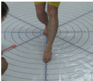
شکل ۳. آزمون تعادل پویا (۲)

تبادل ایستا، هر آزمودنی این تست را سه مرتبه اجرا و میانگین سه اجرای وی به عنوان رکورد نهایی وی در نظر گرفته شد. شافر ۱ پایایی بسیار بالایی (۰/۹۳ - ۰/۸۵) را برای این آزمون گزارش کرده است (۲۳).