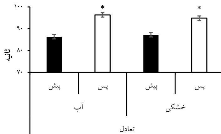
شکل شماره ۳. مقایسه تعادل ایستا (میانگین + انحراف معیار) پیش و پس از شش هفته فعالیت هوازی در آب و خشکی (ثانیه)