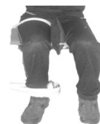
شکل ۱. آزمون چرخش خارجی ران