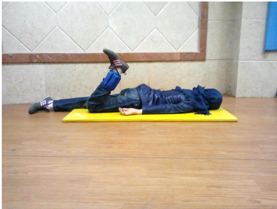
شکل ۲ تمرین قدرتی فلکشن زانو