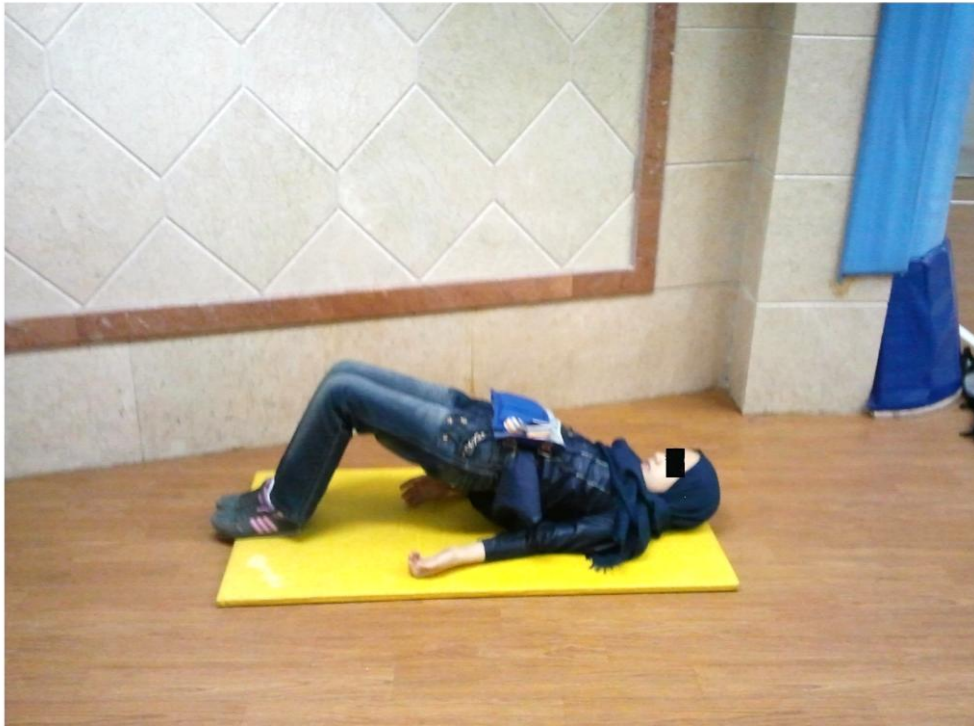
شکل ۱ تمرین قدرتی پل زدن

آماری با استفاده از نرم‌افزار اس پی اس اس نسخه ۱۶ در سطح اطمینان ۹۵ درصد \alpha در سطح معناداری ۰.۰۵ انجام شد.